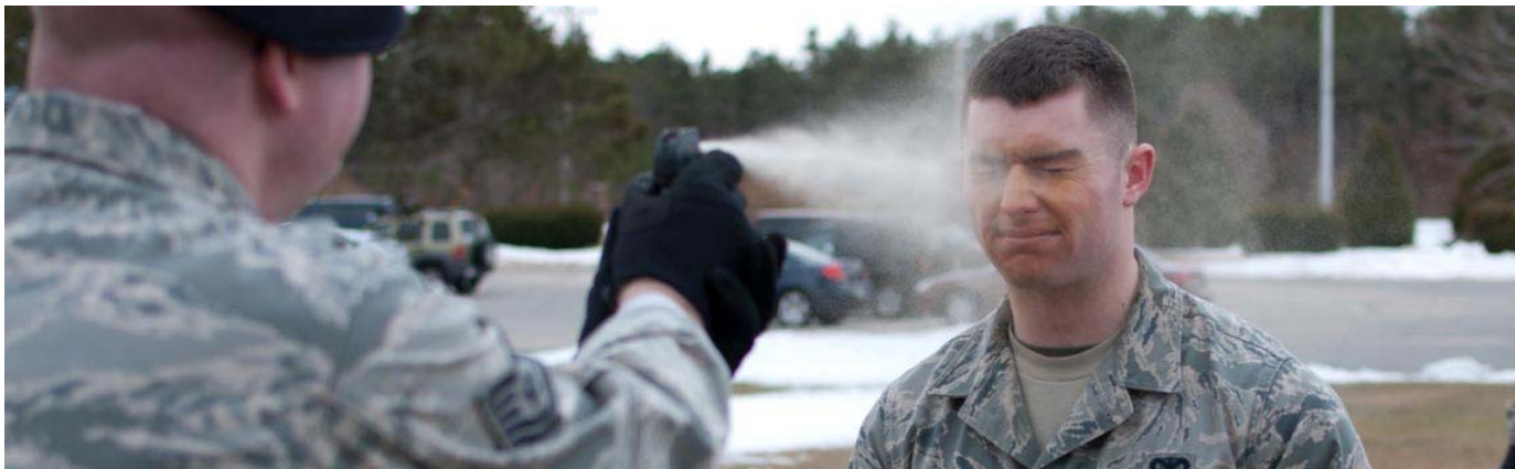
Il getto dello spray va sempre rivolto verso il volto dell'aggressore.

Dopo ogni getto è necessario spostarsi lateralmente o diagonalmente, sia per non essere investiti da eventuali vapori dispersi nell'aria ma anche perchè l'aggressore, pur non vedendo bene, potrebbe comunque lanciarsi nella direzione in cui proviene il getto che l'ha colpito. Anche se può sembrare scontato per molti, è importante tenere presente che il bersaglio dello spray al peperoncino è sempre il volto dell'aggressore.