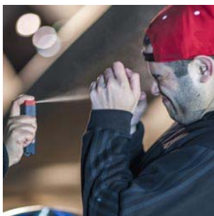
Sono disponibili vari spray al peperoncino, a partire da €8,50.

Il corretto utilizzo di uno spray al peperoncino è fondamentale per massimizzarne gli effetti e mantenerne elevata l'efficacia.